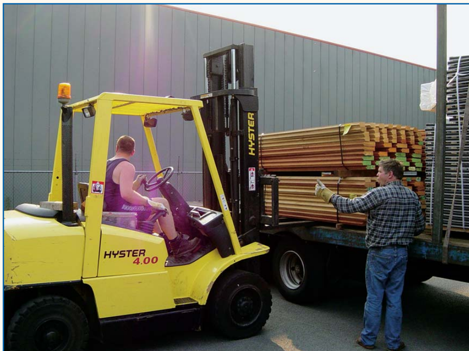
Scholing in de praktijk.

nen in euro's. Wie betaalt er als het misgaat?' De regelgeving zegt dat iedereen een certificaat moet hebben, met uitzondering van chauffeurs die enkel eigen lading laden en lossen en/of enkel hijsen met een lastmoment minder dan tien ton. Een opleiding met certificaat wordt zeker aangeraden bovenop de eendaagse opleiding, die enkel een instructie omvat op basis van gebruiksaanwijzing, training op de machine en/of een maatwerk cursus. 'Met een veertien à zestien tons kraan kun je nog weg met een eendaagse training, maar met een veertig, zestig of zeventig tons kraan gelooft bijna niemand dat je enkel laden en lossen doet', weet Van Bokhorst. 'Al plaats je maar een keer per jaar, dan behoort je het certificaat 'Machinist autolaadkraan met hijsfunctie' te bezitten. Als het immers fout gaat... En wil je dat personeel goed met de kraan kan werken, of wil je dat ze het in de praktijk leren? Dat laatste is vaak de duurste oplossing. Vaak gaat er wat mis.'