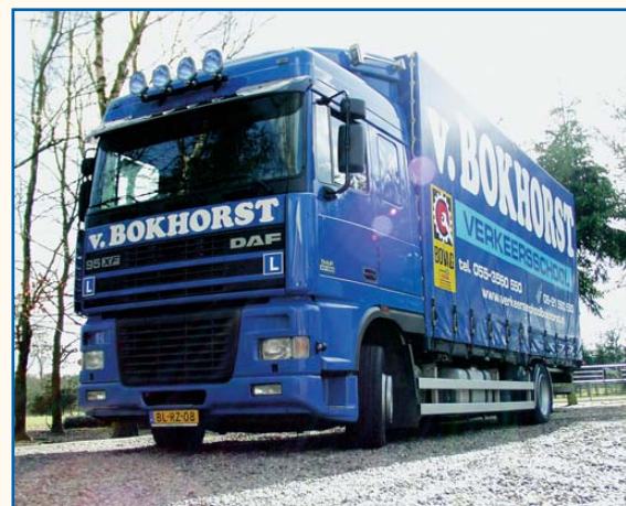
Leswagens van Van Bokhorst.

Voor het geven van opleidingen beschikt het bedrijf onder meer over eigen locaties in Apeldoorn en Emst. Vaak echter wordt op locatie gewerkt, omdat daar de praktijk situatie bij de hand is. 'De ideale situatie komt bij de opleiding ter sprake, maar ik vind: je moet van de werksituatie uitgaan.' Een bedrijf hoeft voor de cursus Autolaadkraan met hijsfunctie niet zelf voor gereedschappen en lasten te zorgen, want Van Bokhorst Transport Opleidingen neemt zelf een container met volledige uit-